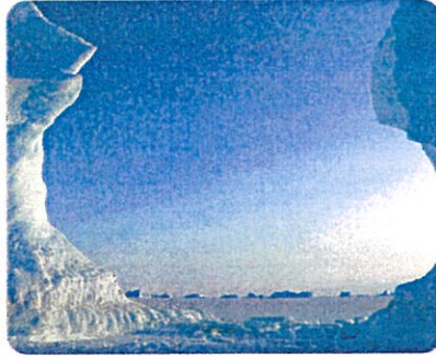
Doc 6. Pôle