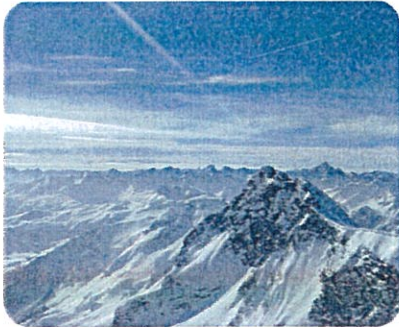
Doc 4. Haute montagne